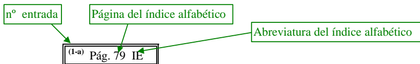
figura el número de esa entrada y la página y abreviatura del índice alfabético en el que se localiza.

Ateroma, ateromatoso ( véase además Arteriosclerosis) 440.9 - carotídea (arteria) (común) (interna) ( véase además Oclusión, arteria, carotídea) 433.1