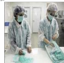
Muere una mujer en Texas por la nueva gripe