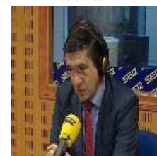
Patxi López espera asistir como lehendakari al fin de ETA