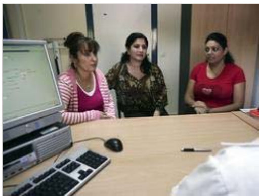
Mujeres gitanas en una consulta

EP MADRID Actualizado Martes, 28 04 09 a las 17:07