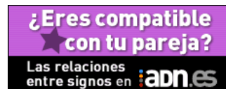
Consulta tam i n tu oróscopo diario el oróscopo de los famosos.