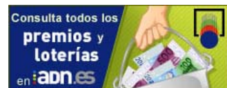
Todos los resultados los premios de la Primita, uiniela, Bonoloto, Loter a Nacional, Euromillones muc os otros.